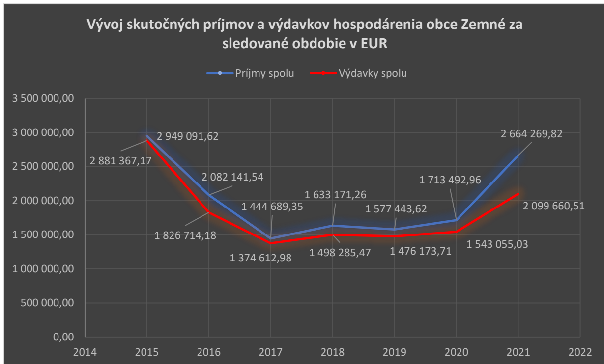
Obr. 6 Rozpočtové hospodárenie obce Zemné k 31.12.2021